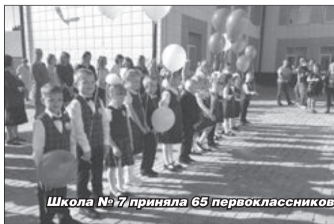
Школа № 7 приняла 65 первоклассников

Новый учебный год начался для школьников Гатчинского района: за парты сели в общей сложности почти 20 тысяч школьников, из них чуть больше двух тысяч — это перво-классники. Торжественные линейки по традиции прошли во всех школах.