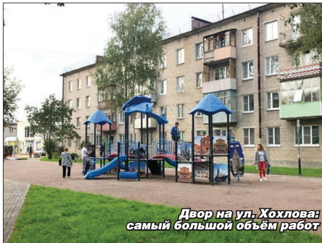
Двор на ул. Хохлова: самый большой объём работ