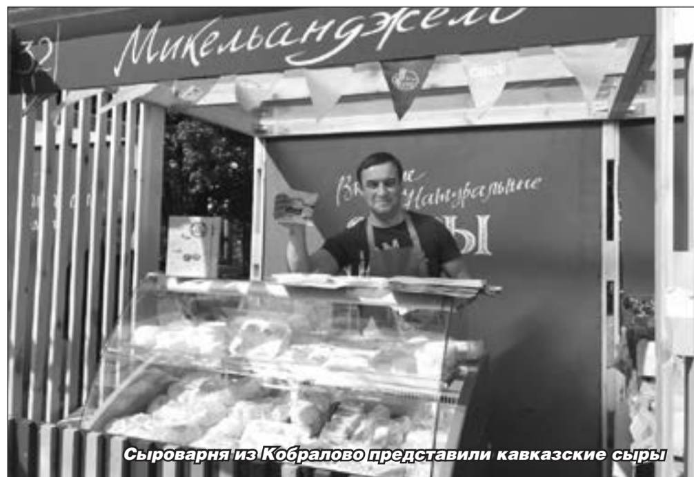
На фермерском фестивале поздравили горожан