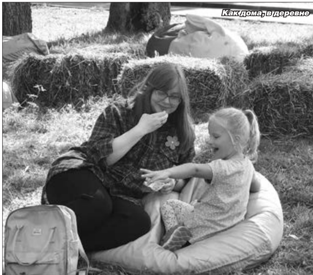
Как дома, в деревне