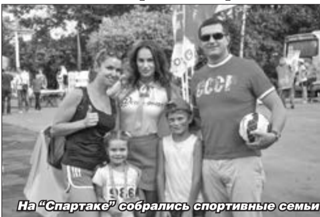
На «Спартаке» собрались спортивные семьи

Солнечная погода и улыбки пришедших участников и гостей на стадион создавали настроение и ощущение праздника. Первыми на старт вышли самые юные участники — дети 3-х лет и младше. Многие из них еще не понимают, что от них хотят взрослые, но главное, что их мамы и папы понимают, что систематические физические упражнения и любовь к ним — это основа крепкого здоровья и успешности в будущем!