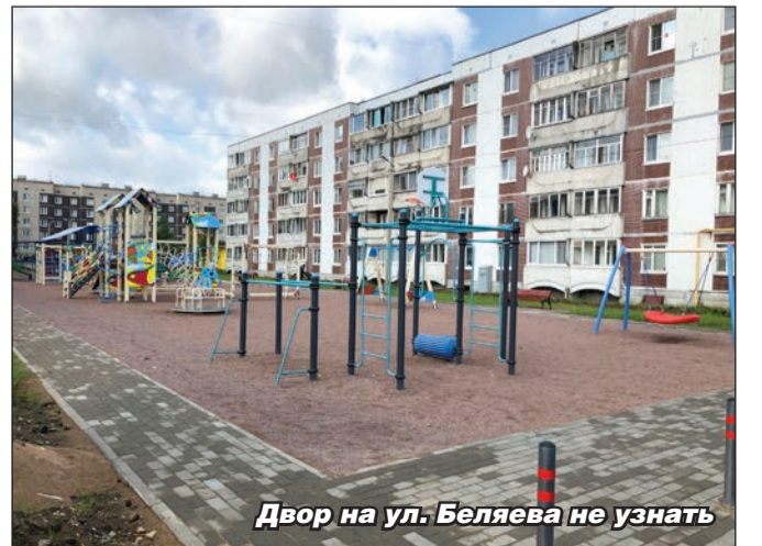
Двор на ул. Беляева не узнать