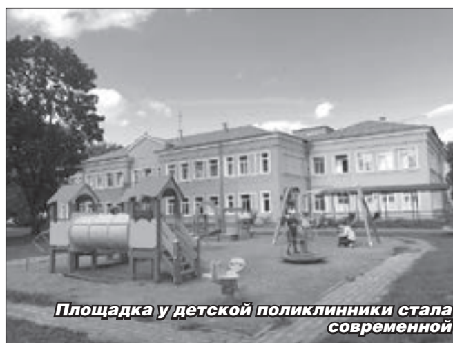
Площадка у детской поликлиники стала современной

Также в рамках завершения обустройства детской площадки на улице Роцинской у бульвара «47 регион» планируется установить детский игровой комплекс.