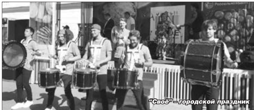
«Свое» — городской праздник