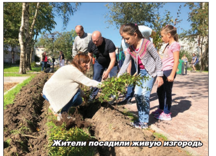
Жители посадили живую изгородь

В обоих дворах появятся камеры видеонаблюдения, здесь уже прошли субботники с участием жителей. Во дворе на Хохлова гатчинцы помогли высадить живую изгородь из кустов кизильника между детской площадкой и дворовым проездом. В Мариенбурге жители общими усилиями помогли сажать деревья. Кроме трудового участия жители этих дворов принимают активное участие в обсуждении реализации проектов благоустройства.