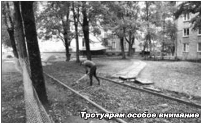
Тротуарам особое внимание