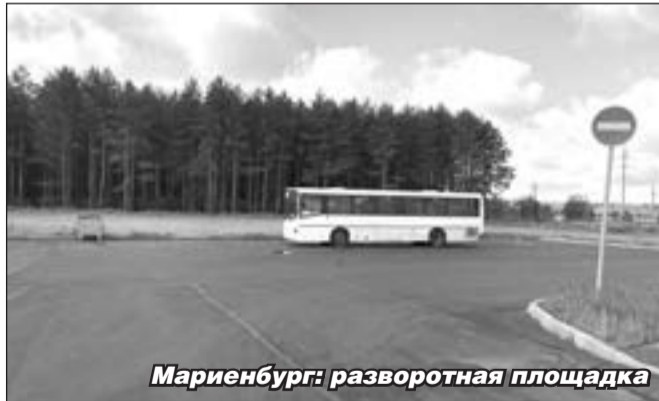
Мариенбург: разворотная площадка

к.1, 19, улица Коли Подрядчикова, д. 22. Работы производятся по заказу администрации Гатчинского муниципального района, ответственным является МКУ «Служба координации и развития коммунального хозяйства и строительства» Гатчинского района. Все работы выполняются по итогам проведения конкурсных процедур. За соблюдением технологий и качеством работ следит технический надзор и заказчик. В случае некачественного выполнения работ или несоблюдения сроков подрядчиков обязывают исправлять выявленные недостатки. Также все указанные объекты в соответствии с контрактом остаются на гарантийном обслуживании подрядчика.