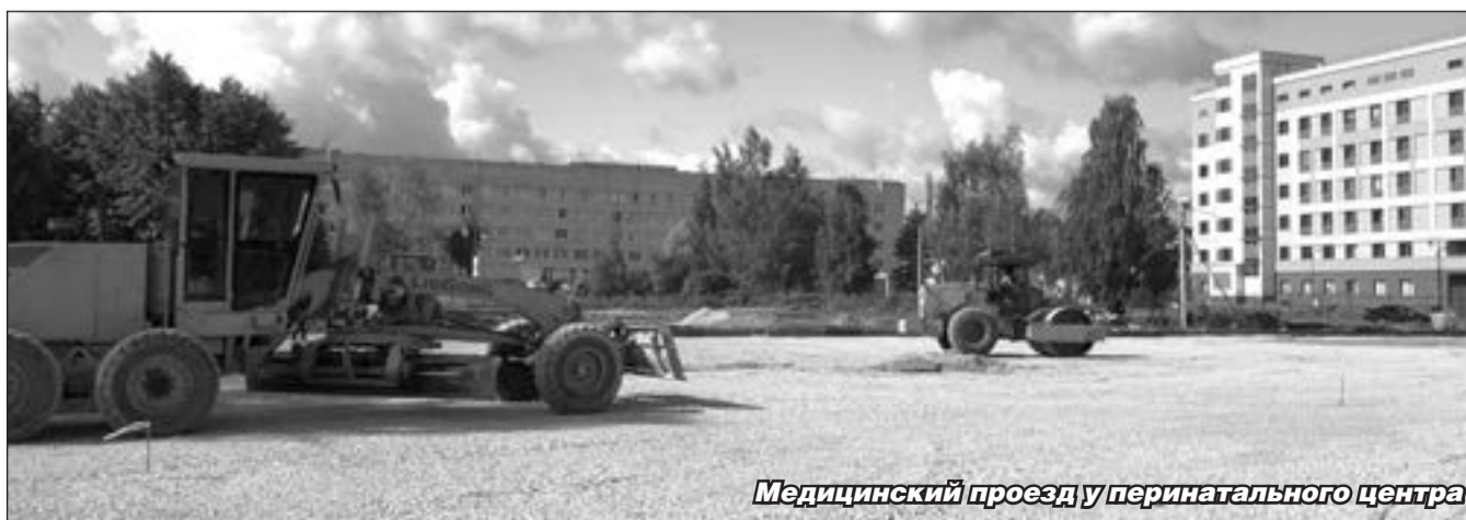
Медицинский проезд у перинатального центра