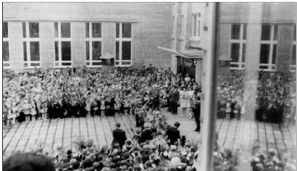
1 сентября 1976 год. Начало учебного года и открытие школы №3.