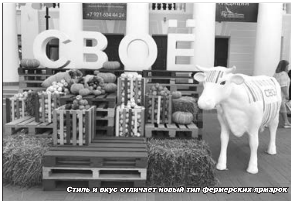
Стиль и вкус отличает новый тип фермерских ярмарок